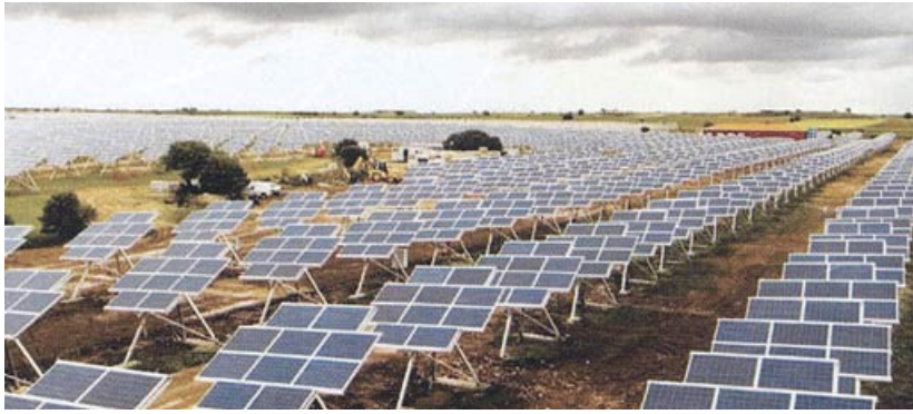
15 MW-Kraftwerk in Mahora.