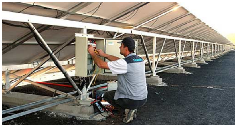
Ein Ingenieur von Siemens arbeitet an einer Solarstromanlage von City Solar.

"Die Wechselrichter sind sehr wichtig für den Betrieb eines Solarkraftwerks. Wir arbeiten hier mit Siemens zusammen. Im Jahr 2003, als unsere erste Solarstromanlage für den Flughafen Saarbrücken errichtet wurde, war Siemens dauerhaft in den Bau einbezogen. Siemens liefert Wechselrichter, Transformatoren, Schaltstationen und kümmert sich um die Entwicklung wie auch um den elektrischen Anschluss. Das Beispiel unserer Transformatoren veranschaulicht unsere Strategie: wir nutzen Trockentransformatoren von Geafol, da sie - obwohl sie viel teurer sind als Öl-Transformatoren - pflegeleicht sind, effizienter arbeiten und umweltfreundlicher sind."