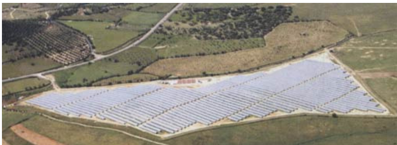
10 MWp-Solarpark Alconchel.