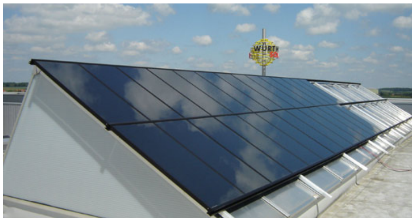
CIS-Testfeld von Würth Solergy in Schwäbisch Hall.

Während Cadmium-Tellurid und amorphes Silizium ihre Vorteile beim Preis und hinsichtlich des Gewichts ausspielen können, erreichen Solarmodule aus Kupfer-Indium-Diselenid die höchsten Wirkungsgrade im Dünnschicht-Vergleich. Sie lassen sich ebenfalls problemlos sowohl mit Transformator- als auch mit transformatorlosen SolarMax-Wechselrichtern kombinieren. Den Markt dominiert derzeit der Hersteller Würth Solergy aus Schwäbisch Hall. Seit vergangenem Jahr verkauft das Unternehmen SolarMax-String- und Zentralwechselrichter als OEM-Produkte im Megawattbereich. Im spanischen Albacete errichtet das Unternehmen derzeit die weltgrößte Freiflächenanlage mit CIS-Modulen und SolarMax-Wechselrichtern. Das System hat eine Leistung von 3,26 Megawatt und soll im Sommer an das Netz gehen.