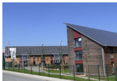
Photovoltaikanlagen auf der Basis von Unisolar-Laminaten.