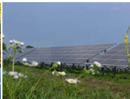
Links: First Solar-Module in einer Anlage der Nastro / Reinecke + Pohl Sun Energy AG in Gescher (NRW) Rechts: PV-Freilandanlage im Gewerbepark