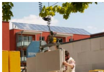
Solarstromanlagen in Marburg (links) und Hamburg.