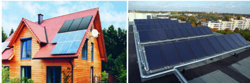
Installation eines Flachkollektor-Systems auf dem Dach eines Einfamilienhauses durch Fachleute des Solarhandwerks. Solarthermie-Anlage auf einem Mietshaus in Berlin-Reinickendorf.