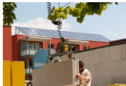
Solar-Siedlung Steinfurt-Borghorst (links); privates Solar-Dach.