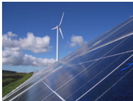
Photovoltaik- und Windenergieanlagen auf einer ehemaligen Hausmülldeponie nahe Hamburg.

Von der erstmaligen Nutzung von Flächen zur Windenergieerzeugung ist der Zubau von Windenergieanlagen an bereits genutzten Standorten im Rahmen der Flächenerweiterung bzw. -verdichtung zu unterscheiden. Aufgrund der bereits bestehenden "Vorbelastungen" können die Akzeptanzprobleme geringer sein als bei der Erstbebauung. Zudem ist die planungsrechtliche Abwicklung deutlich unkomplizierter. Davon wiederum zu unterscheiden ist das Repowering, der Ersatz bestehender durch neue Windkraftanlagen. Hier ist die Akzeptanz ebenfalls höher als beim Neubau, geht doch ein Repowering vielfach einher mit geringerer Anlagenzahl, günstigerer Anlagenanordnung und ruhigerem Erscheinungsbild. Hemmnisse planungsrechtlicher Natur bestehen, wenn die Fläche nicht als Eignungs- oder Vorranggebiet ausgewiesen ist, da ein Repowering dann nicht möglich ist. Ebenfalls möglich ist, dass die Fläche aufgrund der höheren Schalleleistungspegel leistungsstärkerer Anlagen, das heißt auch zu geringen Abständen zum Beispiel zu Wohnbebauungen, nicht (mehr) oder nur eingeschränkt genutzt werden kann. Festlegungen zu Höhenbegrenzungen sind in diesem Kontext ebenfalls zu nennen.