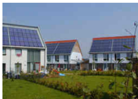
Leuchtturm-Projekte in Niedersachsen und NRW: Bioenergie-Dorf Jühnde (links) und Solar-Siedlung Steinfurt-Borghorst.