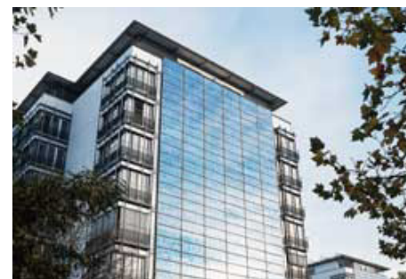
Solarfassaden in Duisburg und Freiburg (rechts)

Größere Hemmnisse identifizierte die Untersuchung bei Fassadenanlagen, die bislang nicht im großen Stil realisiert wurden. Hier können Verschattungen zu gravierenden Ertragseinbußen führen. Ferner ist die Umsetzung einer Fassadenanlage an Bestandsgebäuden teuer und architektonisch oft nur unbefriedigend möglich. Angemessen sind derartige Anlagen nur in (repräsentativen) Neubauten umzusetzen, die jedoch zahlenmäßig sehr begrenzt sind. Bauordnerische Hemmnisse werden als weitgehend unbedeutend eingeschätzt, denn in der Regel können solche Anlagen genehmigungsfrei errichtet werden. Nur in ausgewiesenen Sanierungsgebieten oder bei Baudenkmalern kann eine Baugenehmigung versagt werden, was aber nur einen