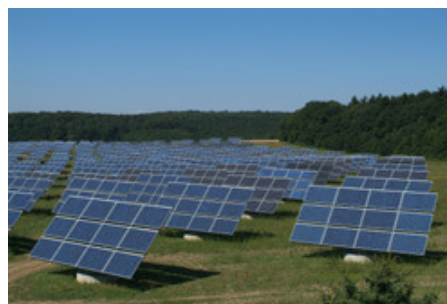
12 Megawatt Solarpark "Gut Erlasee" bei Würzburg.