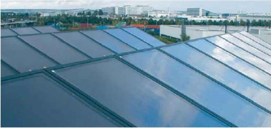
Große Solarthermieanlage zur Klimatisierung eines Hotels.

Günstigere Bedingungen für die Solarthermie bestehen bei Hotels, Altenheimen etc. Teilweise reichen aber die Dachflächen nicht aus, um einen signifikanten Beitrag zu erbringen (z. B. bei Hochhäusern). Obwohl die aufgeführten Hemmnisse genereller Natur sind, bestehen regional deutliche Unterschiede in ihrer Ausprägung. Die Bereitschaft zum Bau einer Solaranlage ist bei EFH-Besitzern im Süden deutlich höher als im Norden oder im Osten Deutschlands, was sich an den Installationszahlen auch deutlich ablesen lässt. Hier treffen die hinsichtlich der PV getätigten Aussagen in gleicher Weise zu. In den neuen Bundesländern wertet die Studie neben der unterdurchschnittlichen Einkommens- und Vermögenssituation auch den Bestand an relativ neuen Heizungsanlagen als Hemmnis. Da die Installation einer Solaranlage häufig mit einer Heizungsmodernisierung gekoppelt wird, existieren in den neuen Bundesländern nur vergleichsweise geringe Investitionsanlässe. Ebenfalls muss der dortige hohe Anteil der gas- und fernwärmeversorgten Wohnungen als Hemmnis genannt werden.