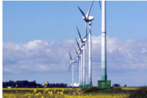
Wasserkraftwerk Rheinfelden (Baden-Württemberg); Windpark auf Fehmarn (Schleswig-Holstein).