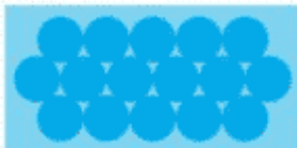
9.75 m x 5 m rechteckig 16 Ringe