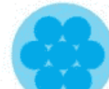
5.50 m rund 7 Ringe