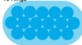
10 m x 5.50 m oval 16 Ringe