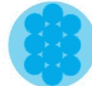
6.50 m rund 10 Ringe