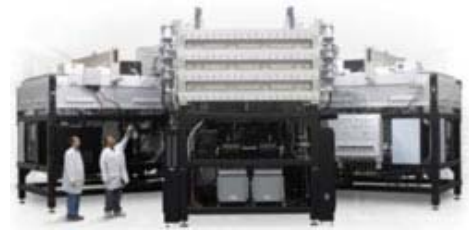
Sichtbares Wachstum: Photovoltaik-Produktionssystem des Herstellers Applied Materials für die plasmaunterstützte chemische Gasphasenabscheidung

Die Autorin beleuchtet die zentrale Rolle der Photovoltaik-Förderung und deren Varianten in Europa, in den USA und in Asien auf dem Weg zur Wettbewerbsfähigkeit. Obwohl in den nächsten Jahren enorme zusätzliche Fertigungskapazitäten geschaffen werden, seien neue Aufgaben sichtbar, die sich aus dem dauerhaft großen Marktvolumen gepaart mit Materialengpässen ergeben können, so das Fazit der US-Analystin.