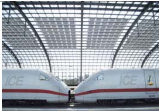
2 Mal High-tech aus Deutschland: Photovoltaikanlage auf dem Dach des Lehrter Bahnhofs in Berlin, ICE der Deutschen Bahn.

Die Lösung der Energiekrise und die Vermeidung der Klimakatastrophe sind nur möglich, wenn der globale Energiemix künftig stärker den Gesetzen der Nachhaltigkeit folgt. Für den Erfolg des Projekts kommt dem Maschinenbau eine Schlüsselstellung zu, denn die Maschinenbauer liefern die entscheidenden Technologien für alle relevanten Branchen, so die Deutsche Bank in einer neuen Studie.