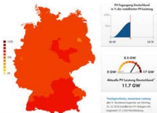
Relative Photovoltaik-Leistung am 23.03.2011, 12 Uhr.

In der 12. Kalenderwoche 2011 war in Deutschland erstmals mehr Solar-Kapazität am Netz als AKW-Leistung. Photovoltaik-Anlagen mit einer Gesamtnennleistung von rund 17 Gigawatt (GW) übertreffen nach dem Herunterfahren der ältesten deutschen Atomkraftwerke erstmals die Kernkraftwerke mit insgesamt etwa 15 GW.