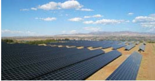
BELECTRIC entwickelte 2010 Photovoltaik-Anlagen mit mehr als 300 MW.

BELECTRIC (ehemals bekannt als Beck Energy) zog dicht vorbei an einem ebenfalls deutschen Unternehmen, der juwi-Gruppe mit Sitz in Wörrstadt. BELECTRIC befindet sich nunmehr fünf Plätze vor dem 2009 erstplatzierten, Q-Cells International.