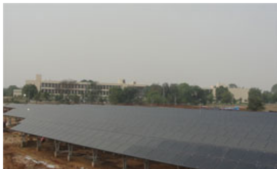
Photovoltaik-Kraftwerk in Gandhi Nagar, Gujarat, entwickelt von GPCL-Gujarat Power Corporation Ltd. und Eversun Energy.

Der Weltmarktanteil der Photovoltaik und der solarthermischen Kraftwerke im asiatisch-pazifischen Raum wächst und wächst.