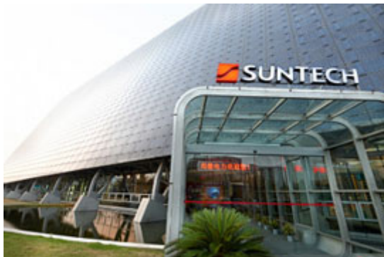
Suntech in Bedrängnis: Die Krise erreicht nun auch die chinesischen Solar-Hersteller

Acht chinesische Banken haben am 18.03.2013 einen Insolvenz- und -Restrukturierungsantrag für die Wuxi Suntech Power Holdings Company Ltd. eingereicht.