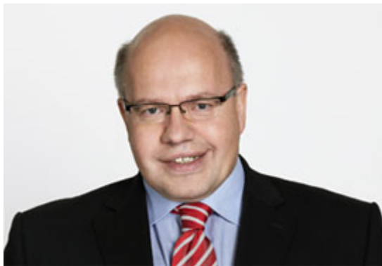
Die Einsparvorschläge von Bundesumweltminister Altmaier (Bild) und Wirtschaftsminister Rösler gefährden den Erfolg der Energiewende

75 Prozent der Deutschen fordern von Bundeskanzlerin Angela Merkel (CDU) einen ungedrosselten Ausbau der erneuerbaren Energien und lehnen die von der Bundesregierung vorgeschlagene Strompreisbremse ab. Das ergab eine repräsentative Umfrage von TNS Emnid im Auftrag von Greenpeace.